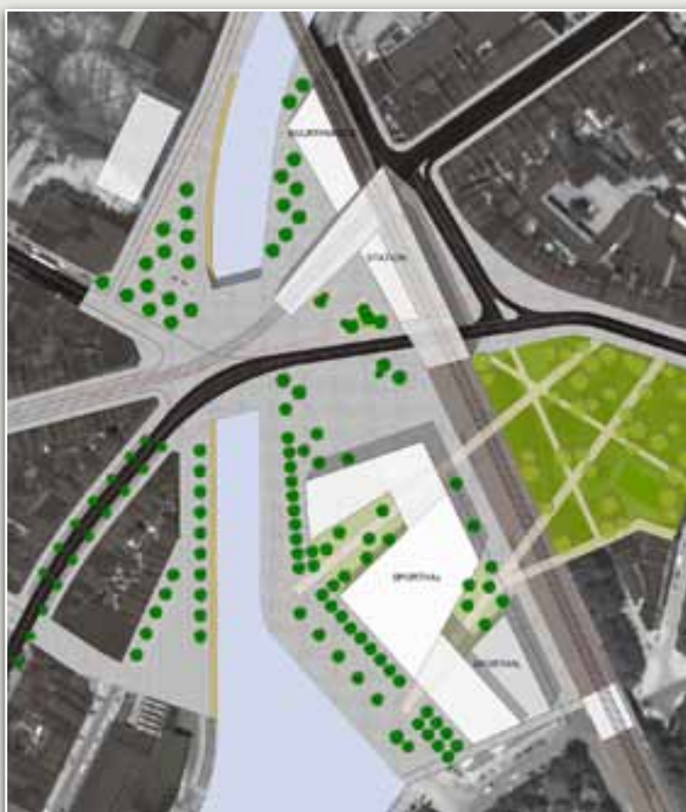
Met de introductie van stedelijke voorzieningen (buurthuis, sportinfrastructuur, evenementenplein, verruimd buurtpark) maakt Nina Reyntjens van deze omgeving meer dan een stedelijke overstaphalte.