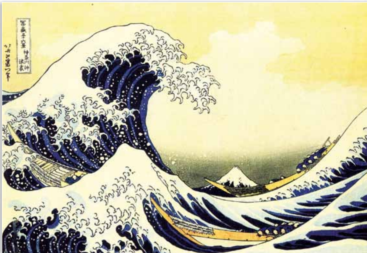
De grote golf, vanuit de kust van Kanagawa, Katsushika Hokusai (1760-1849)

Anders dan het land kent de zee geen traditionele eigendomsstructuur. Onderdelen van de zee zijn in de loop van de jaren wel onder de soevereiniteit van staten gebracht, maar tot vandaag vond er geen doorgedreven ruimtelijke toe-eigening plaats.